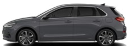
Ecotronic Grey Pearl