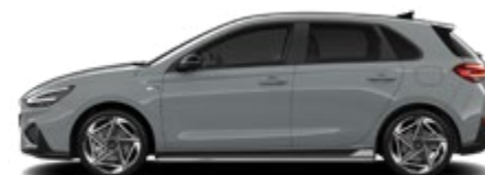
Shadow Grey nur für N Line