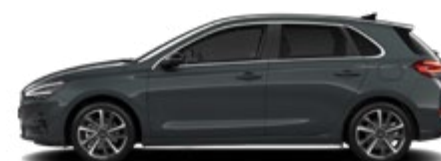
Cypress Green Pearl