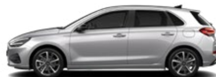
Shimmering Silver Metallic