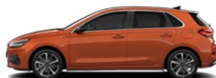
Jupiter Orange Metallic