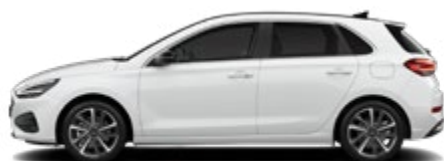
Serenity White Pearl