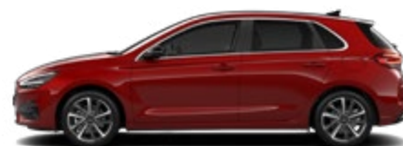
Ultimate Red Metallic