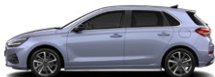
Meta Blue Pearl