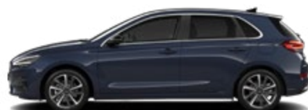
Sailing Blue Pearl